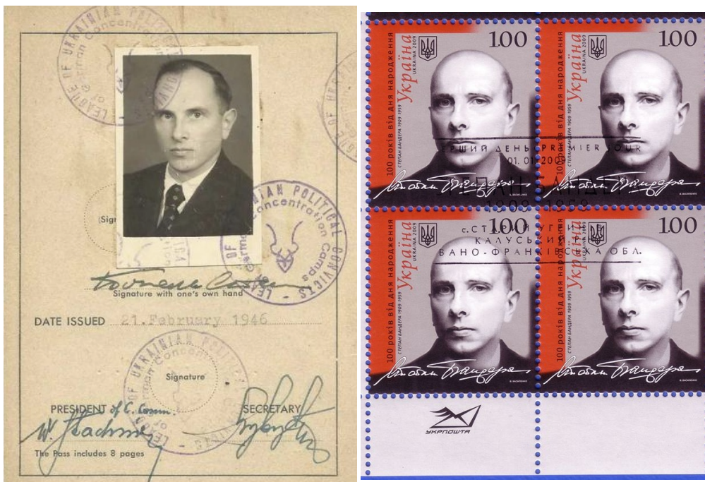
Марка, выпущенная к 100-летию со дня рождения Бандеры