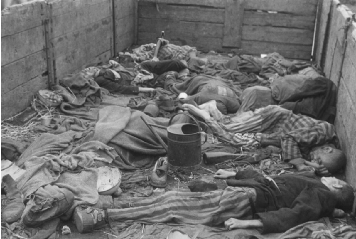
Жертвы марша смерти из Бухенвальда в Дахау