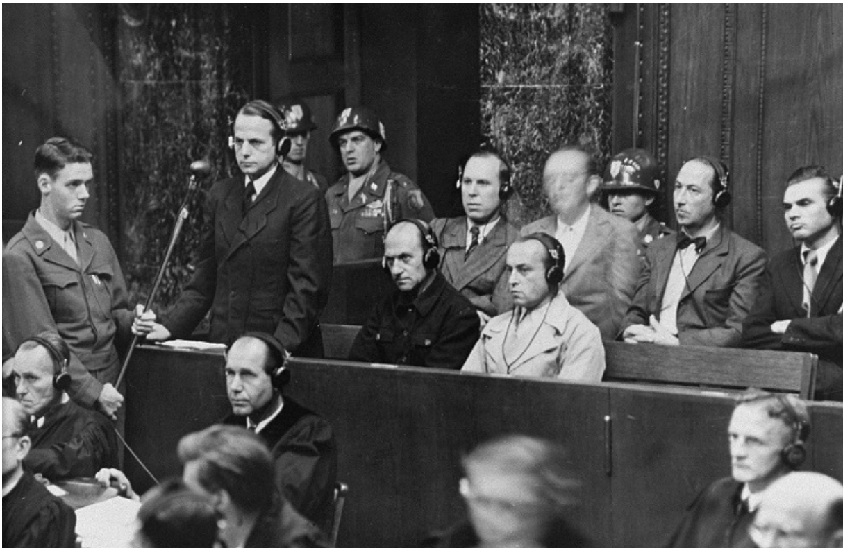
Суд по делу айнзацгрупп, 1947

Это не означает отсутствие попыток привлечь к ответственности главных исполнителей массового убийства 29-30 сентября 1941 года. В 1947-1948 гг. в Нюрнберге проходил так называемый Einsatzgruppen-Prozess, окончившийся обвинительными приговорами.