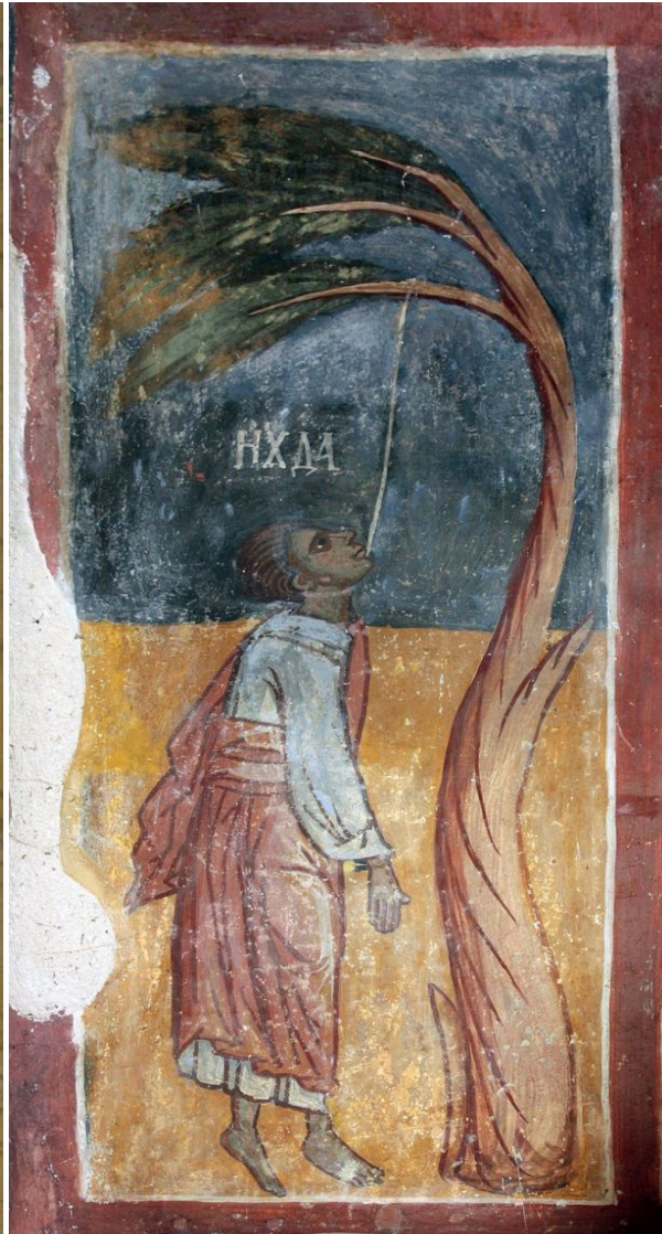
«Самоубийство Иуды», фреска XVI века

— Иуда — один из отрицательных персонажей в этой истории, однако тот факт, что он предал Иисуса, кажется немного наигранным. Утверждается, что он был казначеем общины и крал деньги, но больше не приводится никакой информации о том, каким он был до предательства.