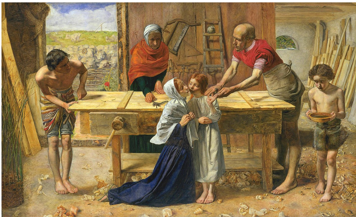
«Христос в родительском доме», худ. Джон Эверетт Милле, 1850

греков. Иисус был подвержен их влиянию, хотя воспитывался как иудей. Он был плотником, способным не только делать мебель, но и строить дома, поэтому, возможно, выучил греческий, чтобы расширить свое дело. В Евангелии от Иоанна приводятся два указания на то, что Иисус знал греческий. Но это не значит, что эллинизм повлиял на его религиозные убеждения. Он оставался иудеем, не подвергавшимся влиянию извне.