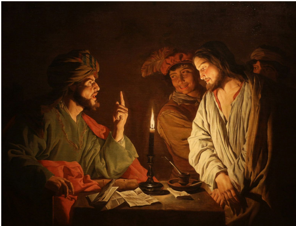
«Христос перед Каиафой», худ. Маттиас Стом, 1630-е

— В итоге Иисуса из Назарета распяли на кресте за призывы к мятежу против Рима, но сначала его судили еврейские священники. Что делало его таким опасным по сравнению с другими пророками и предсказателями?