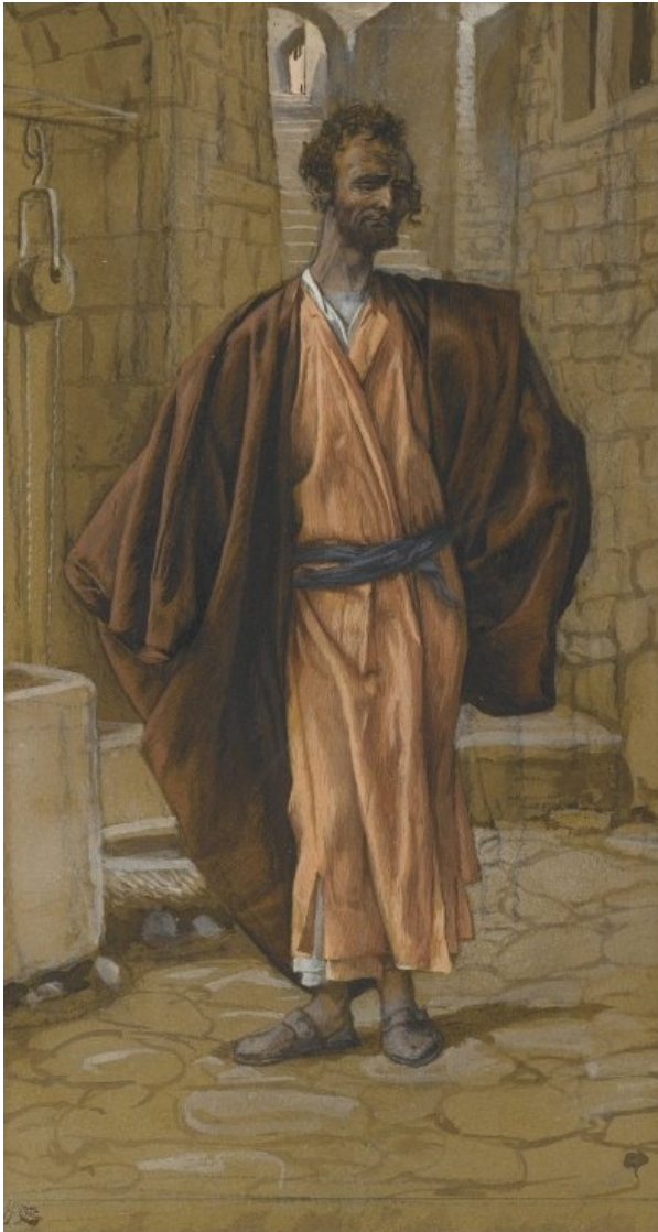
«Иуда Искариот», худ. Д.Тиссо, конец XIX века