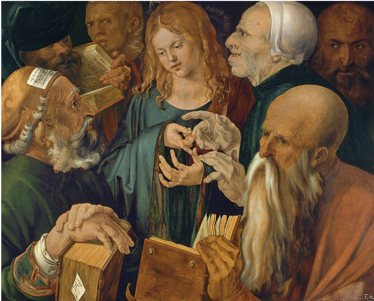
«Христос среди учителей», худ. Альбрехт Дюрер, 1506