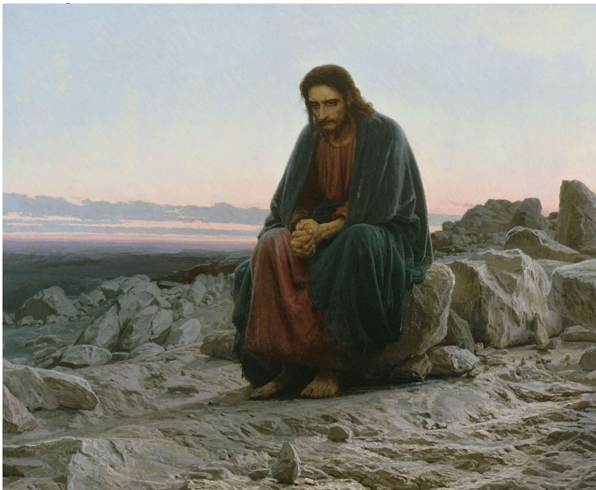
«Христос в пустыне», худ. Иван Крамской, 1872