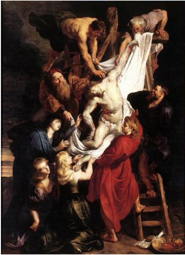
«Снятие с креста», худ. Питер Пауль Рубенс, 1612