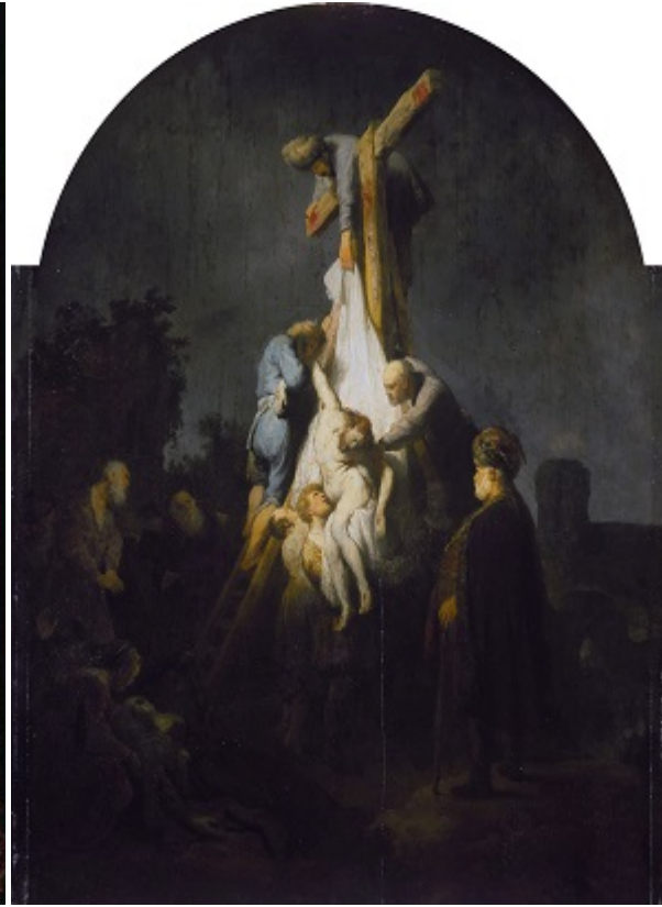
«Снятие с креста», худ. Рембрандт Харменс ван Рейн, 1633

— Вместе с Иисусом были распяты два вора. Вы сомневаетесь в том, что они были обычными преступниками.