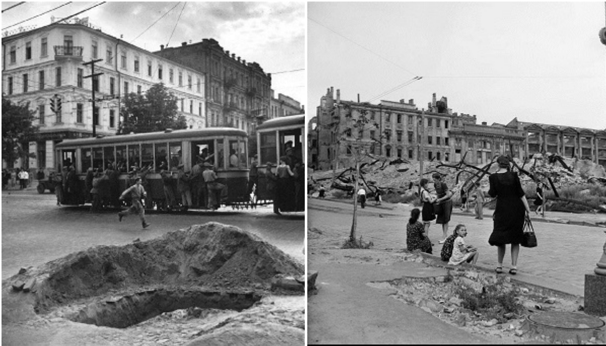
Киев конца 1940-х на фотографиях Роберта Капы

группами подпольщиков и вмешательством в эти разборки Винницкого обкома КПУ. Хотя в 1948-м формальный повод был другим — его уволили якобы за «пропаганду буржуазно-националистической идеологии» в ходе лекции «Националистическая сущность школы Грушевского».