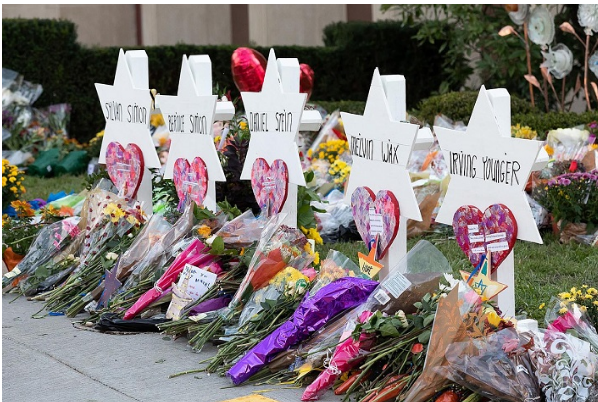
Импровизированный мемориал памяти жертв резни у синагоги «Древо жизни» в Питтсбурге

Мой материал «Сделайте нам антисемитов» анализирует абсурдный опросник Антидиффамационной Лиги, где сами вопросы приглашают давать ответы, квалифицируемые Лигой как проявления антисемитизма. Большинство американских евреев (61%) видит угрозу антисемитизма со стороны правых и лишь 22% со стороны левых. На наших улицах растет уровень антисемитского насилия, а еврейский истеблишмент борется с левыми критиками, подменяя антисемитизм антисионизмом и критикой Израиля.