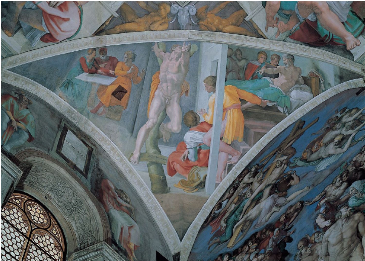
«Наказание Амана». Фреска Микеланджело, Сикстинская капелла

Пребывание в смешанном браке не может не привести к конфликту с традиционной ортодоксией. Большинство смешанных пар отмечает еврейские праздники. Например, Пурим, где последних главах Свитка Эстер говорится об убийстве множества людей, и это, по идее, должно вызывать веселье. Пурим — проблемный момент даже в еврейской традиции (см. мою статью «Праздник еврейского безрассудства» ).