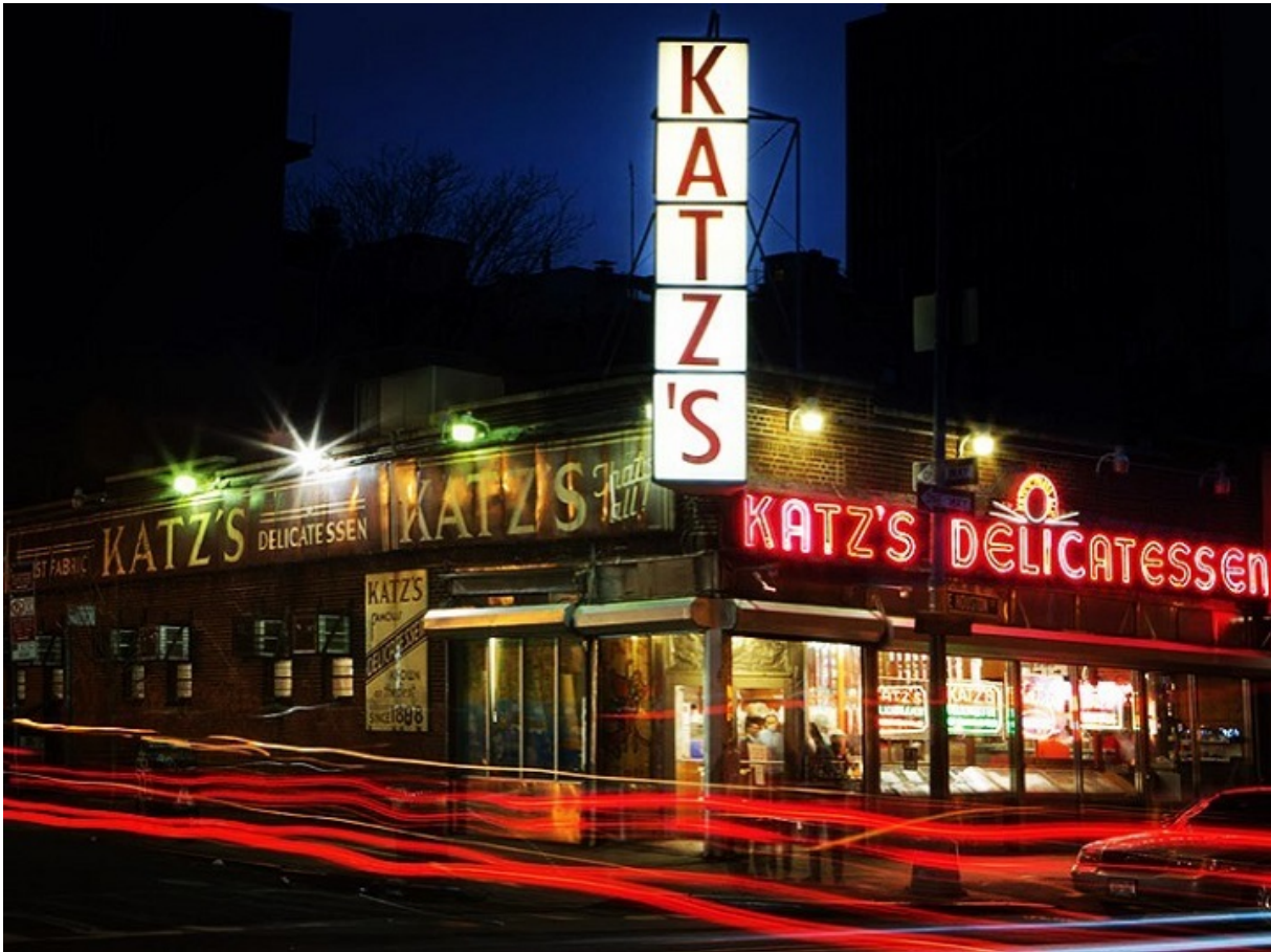
Знаменита делі Katz's Delicatessen у Нью-Йорку

Суперечка про те, кого вважати євреєм, залишається однією з найгарячіших тем для дискусії і в США, і в Ізраїлі, і серед російськомовних євреїв. Не менш актуальне і питання, що представляє собою релігійний єврей? У Хабаді, наприклад, вважають, що всі євреї в тій чи іншій мірі релігійні. За Галахою, звісно ж. Однак Ізраїль, Голокост і антисемітизм давно стали опорними пунктами національної ідентичності. Дослідники називають це світською релігією євреїв. За даними опитування Pew Research Center в те, що Бог Ізраїлю дав євреям Землю Ізраїлю вірить в два рази більше американських євреїв, ніж в самого Бога. А що, якщо не тільки приписи ортодоксальній Галахи, але і вся єврейська активність — це також юдаїзм?