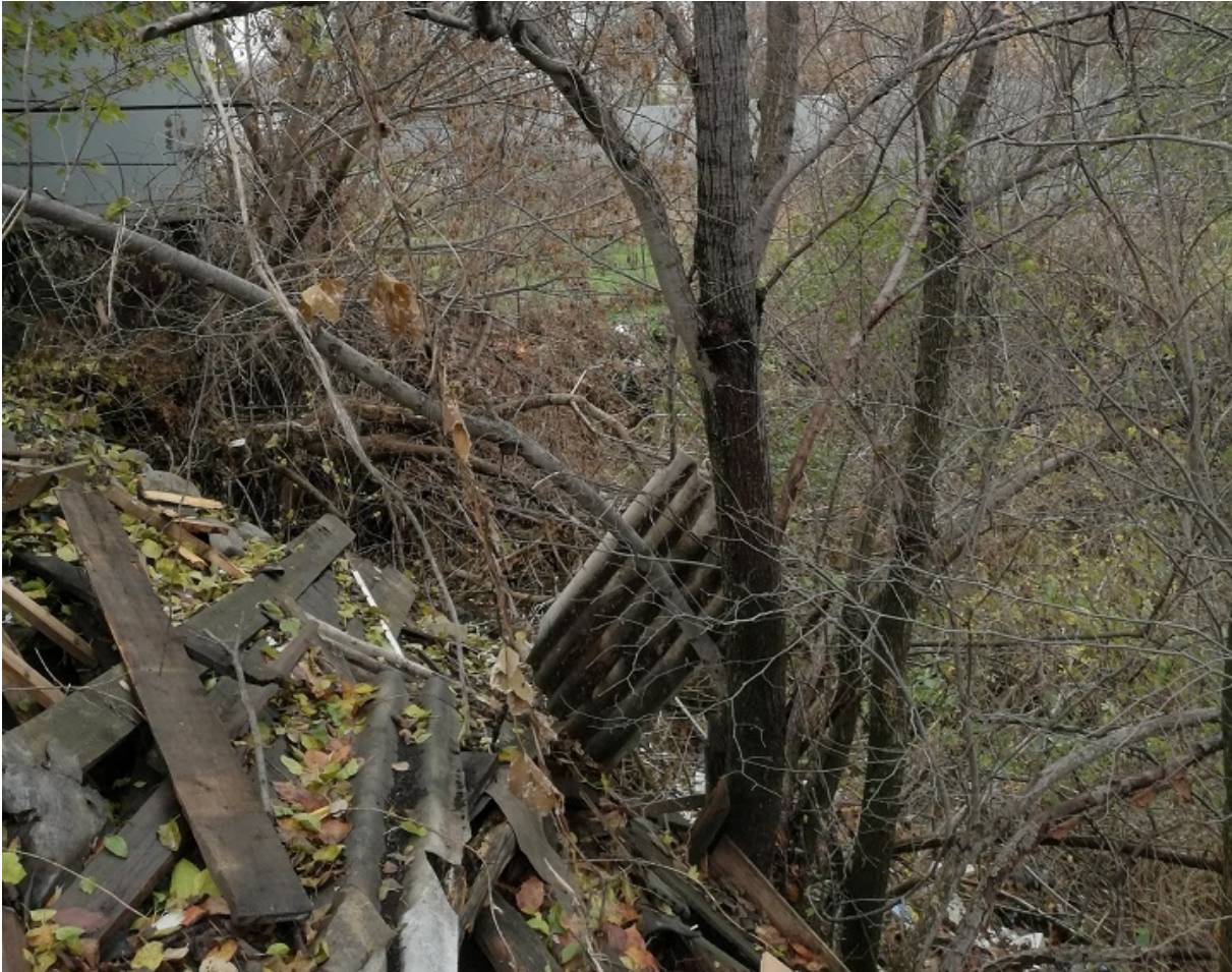
Так виглядає сьогодні Покровський яр, де розстрілювали євреїв

Після війни на цьому місці проклали вулицю, а вже в наш час рів, куди скидали тіла вбитих, місцеві стали потихеньку присипати і будуватися прямо на кістках. Влада прекрасно знала, що представляє собою ця просочена кров'ю і змішана з кістками земля, але продовжувала виділяти ділянки у приватну власність.