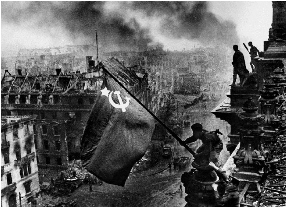
«Прапор перемоги над Рейхстагом».

Символами перемоги союзників у Другій світовій війні стали два фото: червоний прапор над напівзруйнованим Рейхстагом у Берліні і група американських солдатів, що встановлюють американський прапор на Іводзімі. Автор першого знімка — уродженець Юзівки Євген Халдей. Під час єврейського погрому 13 березня 1918 року були вбиті його мати (при спробі захистити сина) і дід, а сам однорічний Женя дістав кульове поранення в груди. У 13 років прийшов на завод, тоді ж захопився фотографією і в 16 став фотокором. З 1939 року Халдей — кореспондент «Фотохроніки ТАСС». За чотири роки війни пройшов зі своєю камерою від Мурманська до Берліна. В історію увійшли його кадри з конференції в Потсдамі й підписання акту капітуляції Німеччини. Фотографії Євгена Халдея були представлені в якості речових доказів на Нюрнберзькому процесі.