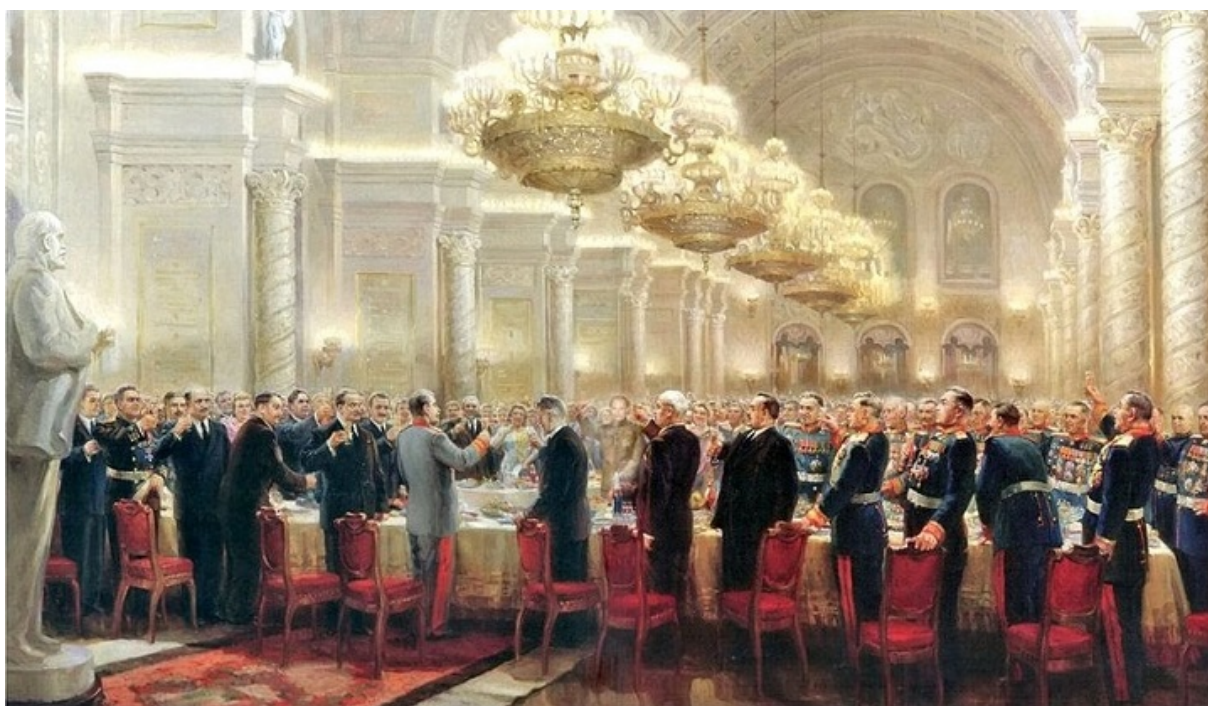
«За великий російський народ», худ. Михайло Хмелько, 1947 рік