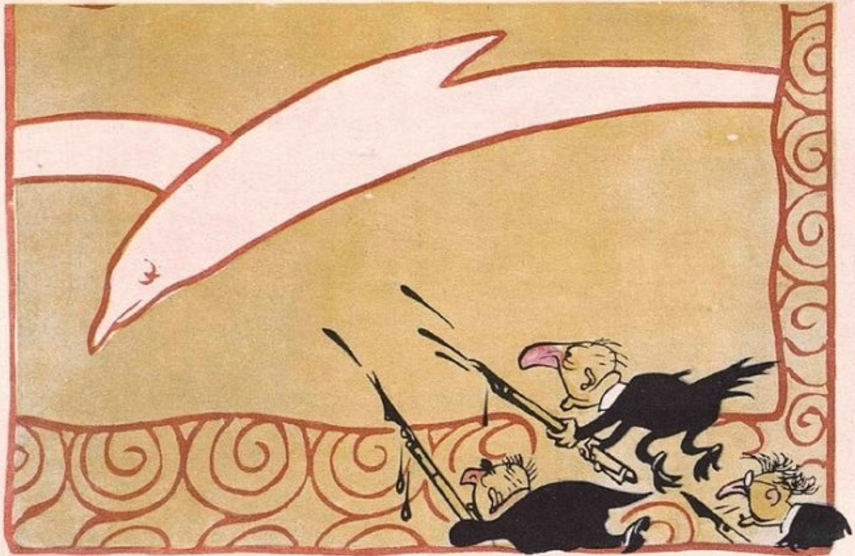
Рис. Вор. ЕФИМОВА

Космополиты-пигмеи пытались подстрелять мхатовскую чайку.