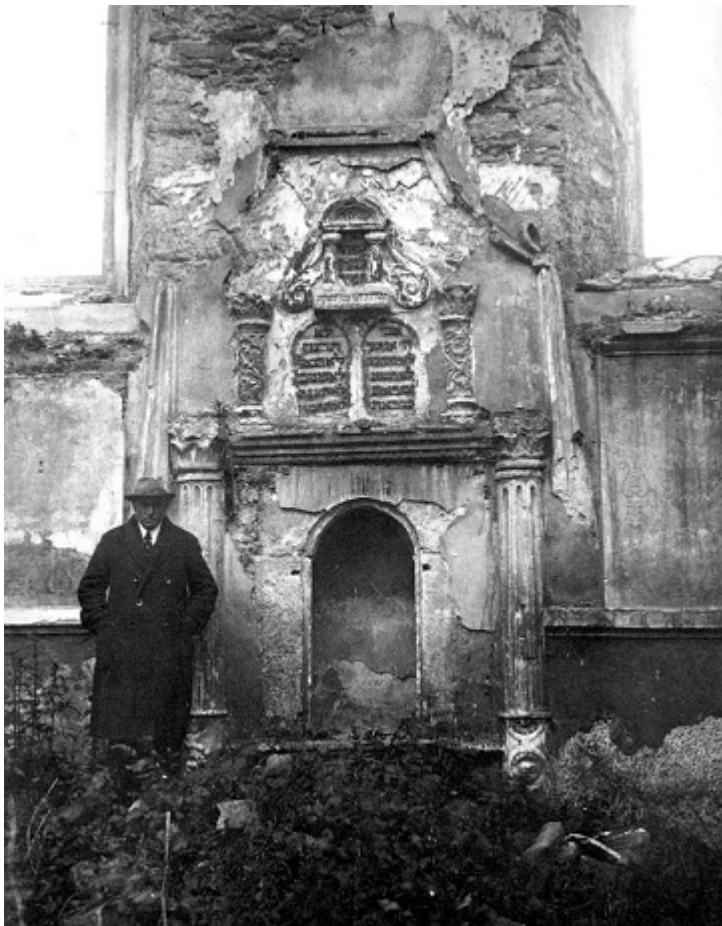
Арон-кодеш синагоги, 1920-е