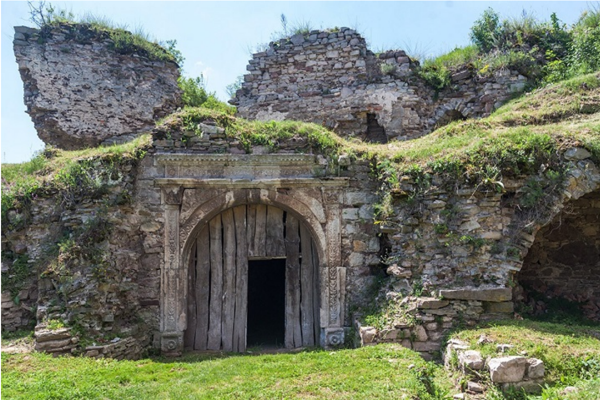
Руины язловецкого замка

Згідно з переписом платників подушного податку, станом на 1662 рік у Кам'янці нарахували 261 єврея, у Язловці — 160, а ось у Сатанові — всього 41-го.