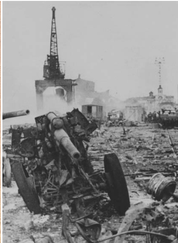
Уничтоженные советские орудия, Одесса, осень 1941 года