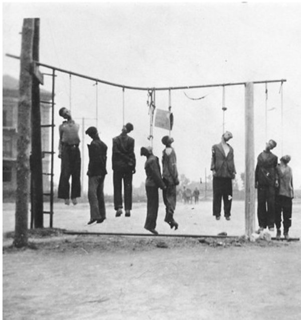
Без суда и следствия...

В октябре 1941-го тысячи евреев остались лежать в противотанковых рвах близ села Дальник, а в январе 1942 года 35-40 тысяч одесситов «неправильной» национальности выселили в гетто, где половина узников не пережили зиму.