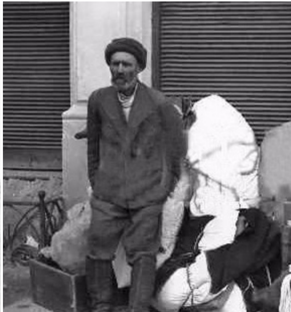
Еврей перед отправкой в Дальницкий лагерь

Потом были массовые расстрелы и депортации в различные лагеря смерти, поэтому к моменту освобождения в городе осталось лишь 600 евреев из 60 тысяч, зарегистрированных в ноябре 1941-го — уже после первой волны репрессий.